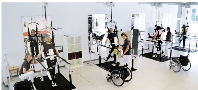
(装着型サイボーグ「HAL®」)

さらに、当社グループには出資機能もあり、バイオ系企業への出資実績も豊富です。入居企業は、当社または当社のCVC(CEJファンド)から資金供給を受けながら、一緒に事業を進めていくことができます。Tech系の企業で、ここまでの環境を保有しているのは、世界でも当社だけでしょう。