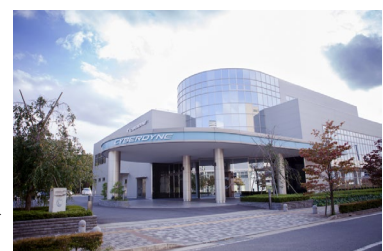
(山海社長にお話を伺った CYBERDYNE本社)

〒305-0818 茨城県つくば市学園南二丁目2番地1 CYBERDYNE株式会社 代表 : 029-855-3189 https://www.cyberdyne.jp