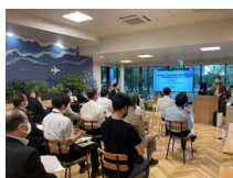
6月には第41回Tonomachi Cafeも開催されました

キングスカイフロントの立地機関とLINK-J会員は、来訪者との打ち合わせ、同僚や立地機関同士の交流などに活用できます。コーヒーの無料サービスもありますので、キングスカイフロントの新たな交流の場としてご活用ください。