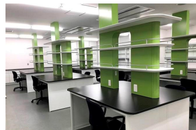
iCONM内に設けられたiCONM in collaboration with BioLabs用のラボベンチ。1ベンチから利用可能で、個別冷蔵庫なども付属しており、その他施設内の分析機器も利用可能。

本事業は、スタートアップがグローバルに活躍しやすい環境をキングスカイフロントに立地するiCONMに整備することで、エコシステムの基盤を川崎市と連携して構築する極めてユニークな取り組みです。同日に開催された記念セレモニーでは、BioLabs CEOのヨハネスフルハーフ氏から、「iCONMへ入居したスタートアップはBioLabsのグローバルネットワークに参画することができる。そのネットワークを基に、川崎がバイオ系のスタートアップのハブとなり、川崎・キングスカイフロントを世界の様々な人や動きなどを惹きつけるビジネス拠点となって、雇用・新産業へ貢献していきたい」と力強いメッセージがありました。本連携が日本のイノベーションを加速させ、新たな技術を社会実装につなげる契機としてまいります。