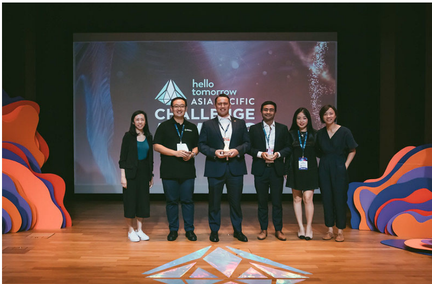
Hello Tomorrow Asia Pacific 2022 登壇者のみなさんと / Hello Tomorrow Japan