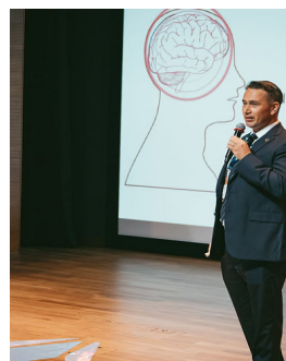
Braizon Therapeutics Co / Hello Tomorrow Japan

世界大会にあたるGlobal Summit in Parisは、2023年3月9日～10日に開催される予定で、Global Challengeの優勝チームが決まります。最先端技術を開発している約1000のスタートアップや、300を超えるディープテクノロジー投資家などDeep Techに関わるプレイヤーが一同に会する中で、同社の技術に注目が集まることでしょう。皆様、応援をよろしくお願いします。