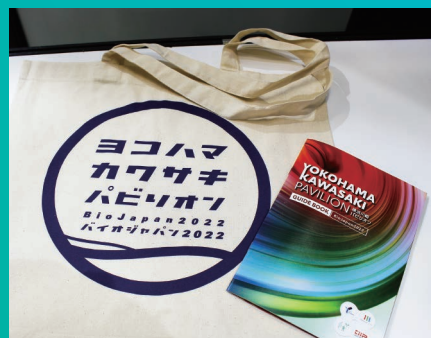
ノベルティとパンフレット