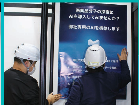
ポスター掲示等サポート