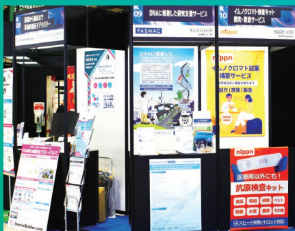
自社で工夫を凝らした展示台