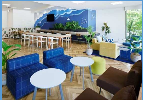
(LINK-J コミュニケーションラウンジ)