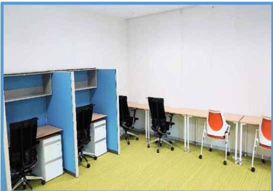
(キングスカイフロントマネジメントセンター)